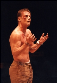
Ismael Die Vergewaltigung