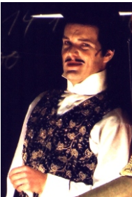
Mackie Messer Die Dreigroschenoper